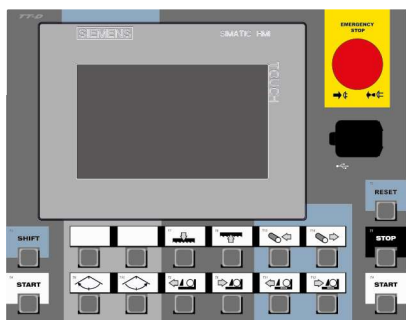
CONTROL PANEL: SIEMENS (X-CNC)